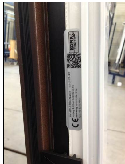
Im Festteil mittig rechts (nach Demontage der Glasleiste).